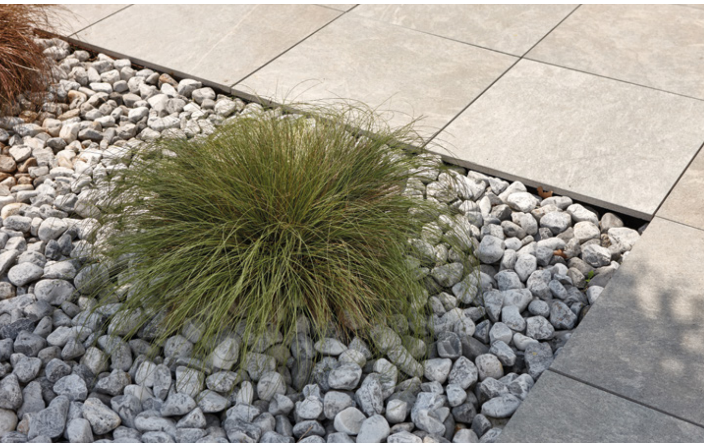
Autosalone Bossoni Brescia

Negli interventi di riqualificazione e ristrutturazione L'Altra Pietra® risulta essere il prodotto ideale per sostituire in economia , ma con caratteristiche alta qualità, una pavimentazione di cemento ormai datata .