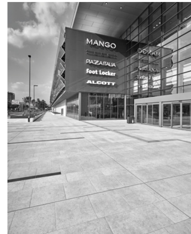
Colosseo Pietra di Gerusalemme - Verona.

Numerose sono le collaborazioni con l'azienda Eterno Ivica